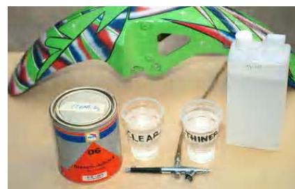
Gambar 7.8 Contoh cat dan pelarutnya