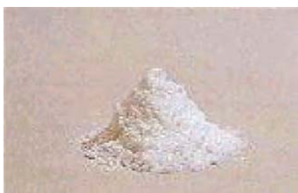
Gambar 7.13 Serbuk kokain