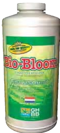
Gambar 7.10 Kemasan pupuk Bio fertilizer

dihasilkan sangat banyak. Sebagai contoh, setiap satu hektar lahan menghasilkan 4,7 ton jerami padi; 0,3 ton sekam padi; serta 0,47 ton jerami jagung dan bagase. Tentu saja jumlah limbah ini merupakan peluang untuk diolah dan dikembalikan ke dalam tanah sebagai pupuk organik.