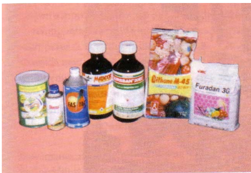
Gambar 7.11 Berbagai produk pestisida