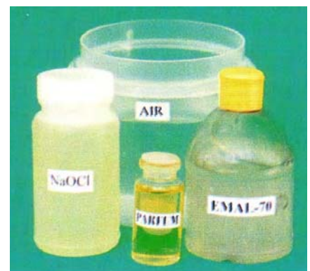
Gambar 7.1 Bahan baku cairan pemutih

Pemutih yang paling banyak beredar di pasaran adalah jenis natrium hipoklorit. Natrium hipoklorit dan kalsium hipoklorit mempunyai sifat multifungsi. Selain sebagai pemutih, kedua senyawa ini dapat berfungsi sebagai penghilang noda dan desinfektan ( sanitizer ). Fungsi ganda NaOCl sebagai penghilang noda maupun desinfektan, dapat menjadi keunggulan ekonomis. Pemutih dapat ditemukan dalam dua wujud, yaitu padat dan cair. Pemutih padat (bubuk putih) adalah kalsium hipoklorit dengan rumus kimia \text{Ca}(\text{OCl})_2 . Pada umumnya, masyarakat mengenal senyawa ini sebagai kaporit. Kaporit lazim dipakai untuk