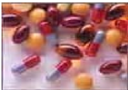
Gambar 7.12 Tablet ekstasi