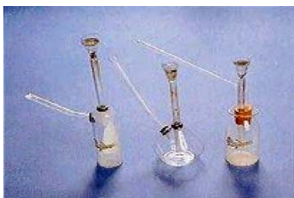
Gambar 7.15 Labu kokain

Psikotropika adalah obat keras tertentu bukan narkotika yang diperlukan dalam pengobatan, namun dapat pula menimbulkan ketergantungan psikis dan fisik yang sangat merugikan bila digunakan tanpa pengawasan yang seksama. Adanya pengawasan yang ketat terhadap peredaran narkotika, maka psikotropika dijadikan sebagai pengganti. Psikotropika mempunyai efek dan bahaya yang sama dengan narkotika.