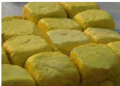
Gambar 7.4 Tahu kuning