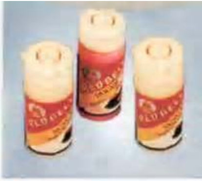
Gambar 7.2 Contoh kemasan pewarna sintetis

makanan atau minuman yang tidak beralkohol, misalnya nasi kuning, tahu, temulawak, dan sari buah.