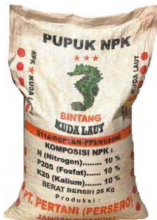
Gambar 7.9 Kemasan pupuk SP dan NPK