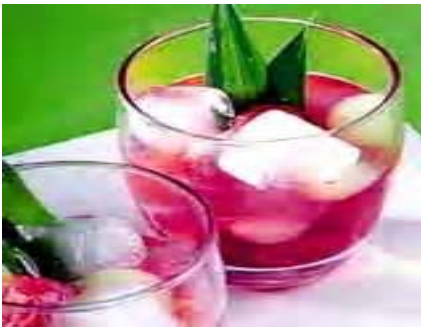
Gambar 7.3 Contoh makanan yang menggunakan pewarna

Beberapa kelebihan pewarna sintetis antara lain, warnanya seragam, tajam, mengembalikan warna asli yang mungkin hilang selama proses pengolahan, melindungi zat-zat vitamin yang peka terhadap cahaya selama penyimpanan, dan hanya diperlukan dalam jumlah sedikit. Seiring dengan meluasnya pemakaian pewarna sintetis, sering terjadi penyalahgunaan pewarna pada makanan. Sebagai contoh digunakannya pewarna tekstil untuk makanan sehingga membahayakan konsumen. Zat pewarna tekstil dan pewarna cat biasanya mengandung logam berat, seperti: arsen, timbal, dan raksa sehingga bersifat racun.