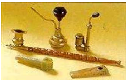
Gambar 7.14 Alat-alat penghisap ganja